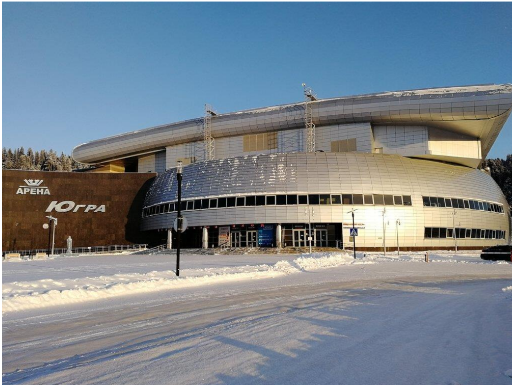
Ледовый дворец в г. Ханты-Мансийск