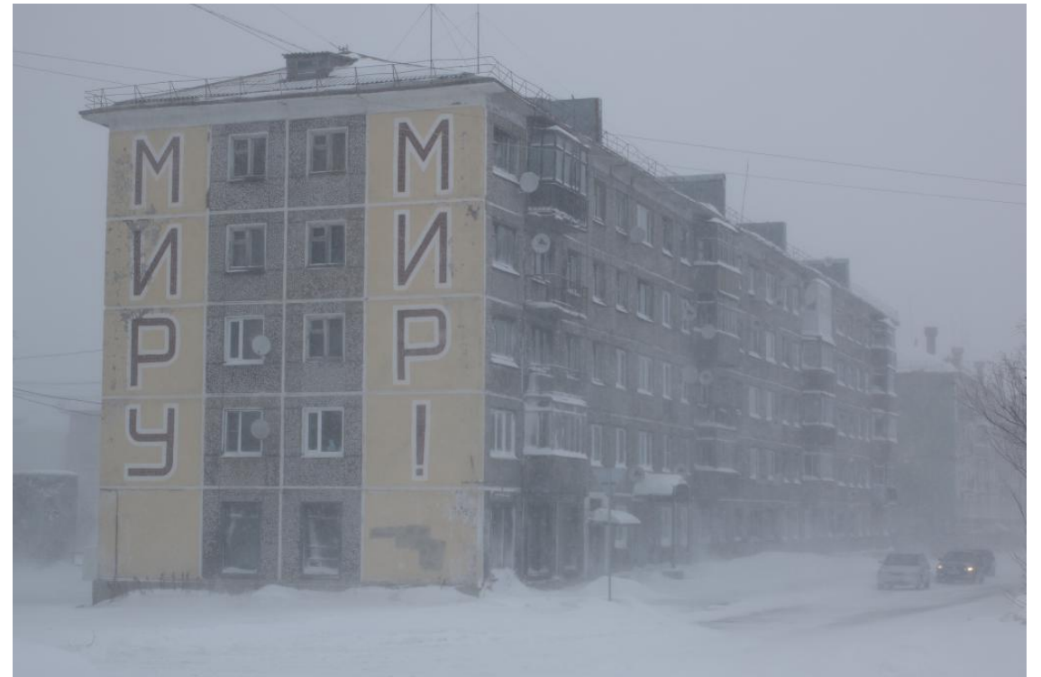
Типовая панельная пятиэтажка в одном из городов Крайнего Севера