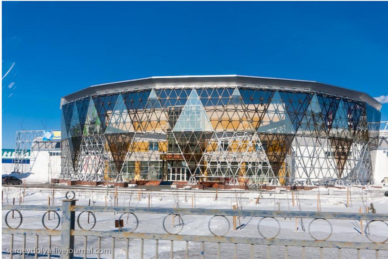
Конгрессно-выставочный центр «Югра-Экспо» г. Ханты-Мансийск

Идея книги – «окружение воздействует на чувства, а чувства на желания».