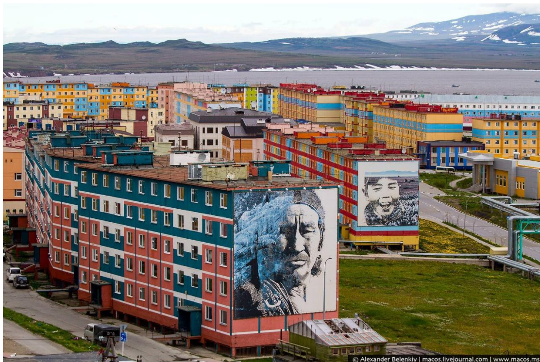
Типовые панельные дома в хорошем состоянии