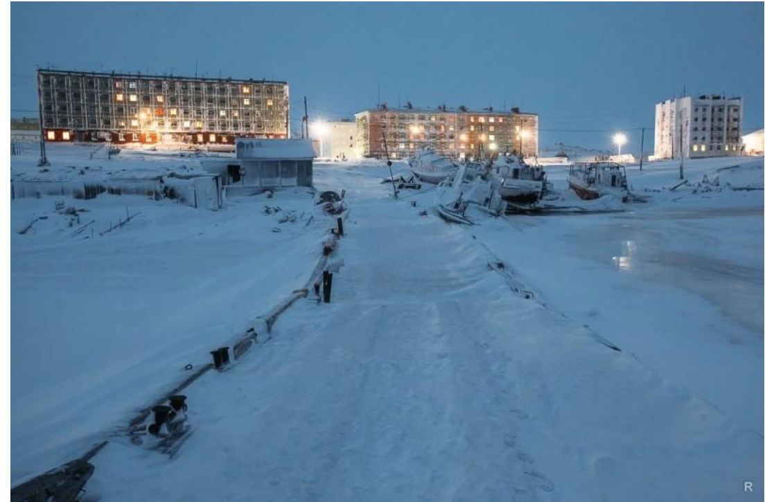
Природа вокруг, но нет облагороженного места отдыха для жителей города