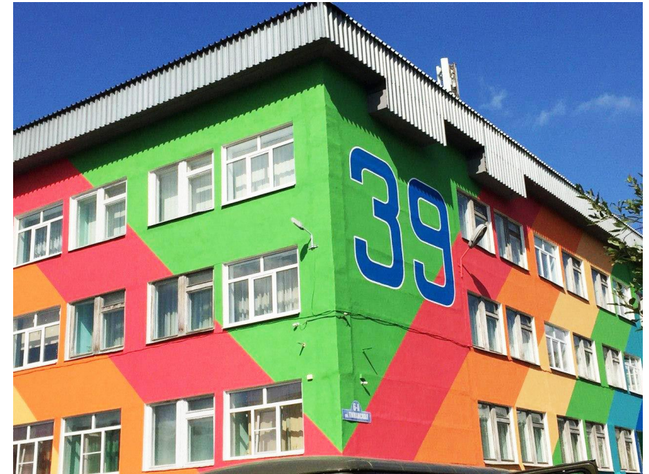
Школа в г. Воркута Чересчур яркие цвета, которые сильно давят на психику