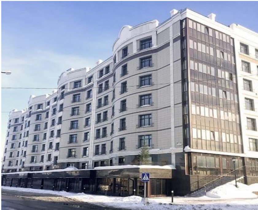
Жилой дом в г. Ханты-Мансийск Здание, которое хочется рассматривать