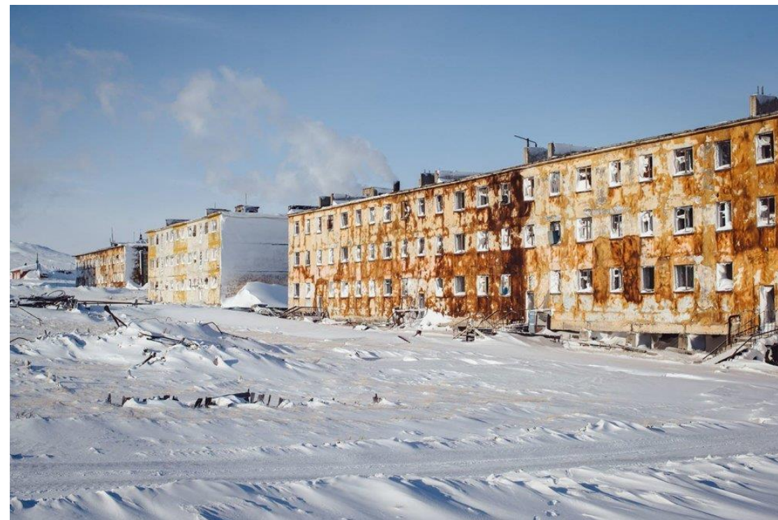
Типовые панельные дома в аварийном состоянии