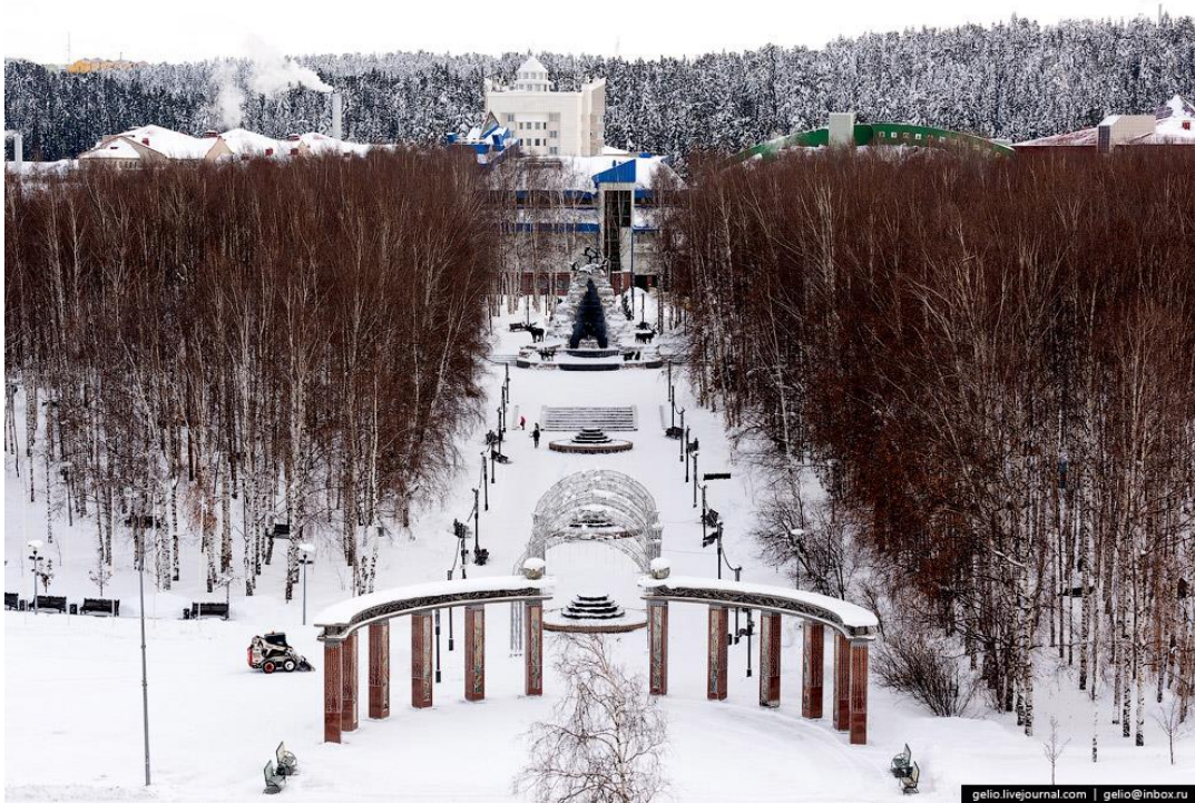
Облагороженный городской парк